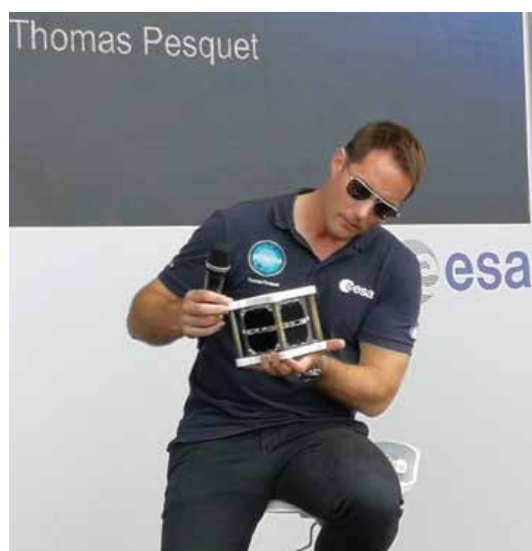
« L'astronaute Thomas Pesquet présente le nanosatellite MTCube lors du Salon International de l'Aéronautique et de l'espace du Bourget 2019 »