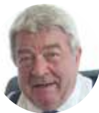
Jean-Claude GAYSSOT Président de la FVA, ancien ministre